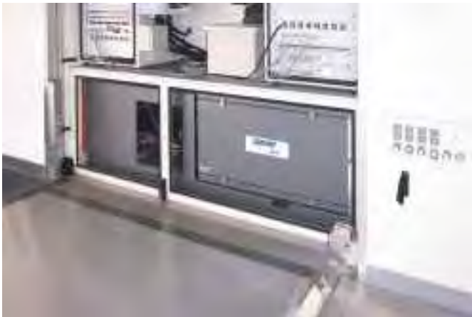
Coolmino Tunnel geschlossen Coolmino Tunnel closed

Dieses Bauteil liefert STROM / KÄLTE / WÄRME - Netz oder Netz-unabhängig