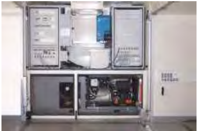
Coolmino Tunnel geöffnet. Klimaanlage als Splittsystem unter Containerdecke. Coolmino Tunnel opened. AC-unit as splitunit under container roof

This construction unit supplies CURRENT/COLD or HEAT – shore powered or independent.