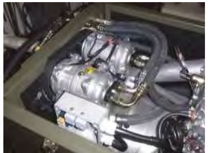
Doppelverdichter auf Stromerzeuger Tandem compressors on generator-set